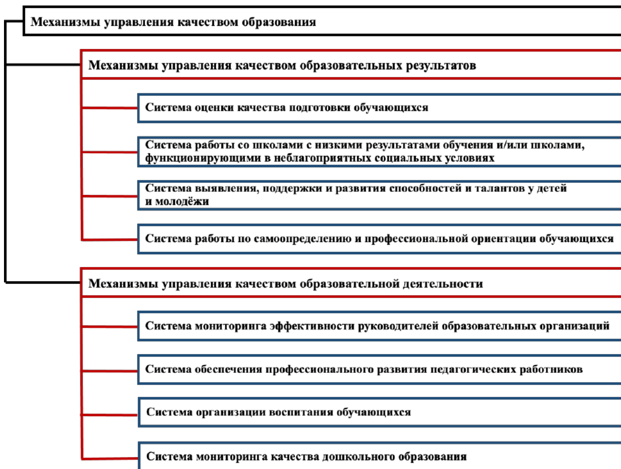
Рисунок 1 – Направления оценки

Направления Оценки представлены на рисунке 1.