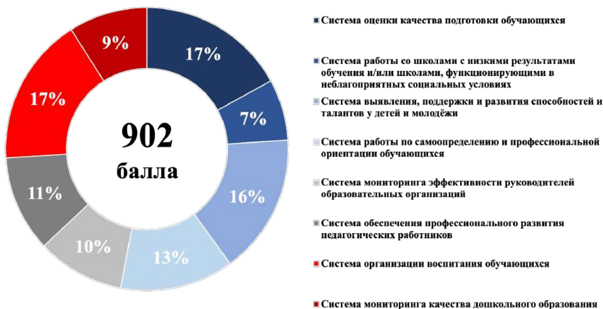
Рисунок 3 – Структура итогового балла

Максимальный итоговый балл по результатам проведения Оценки составляет 902. Структура итогового балла представлена на рисунке 3. Максимальные баллы по направлениям представлены в таблице 1.